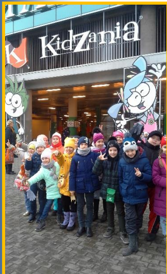
УЧАСТНИКИ ПРОЕКТА «ИЗУЧАЙ РОДНОЙ КРАЙ!»