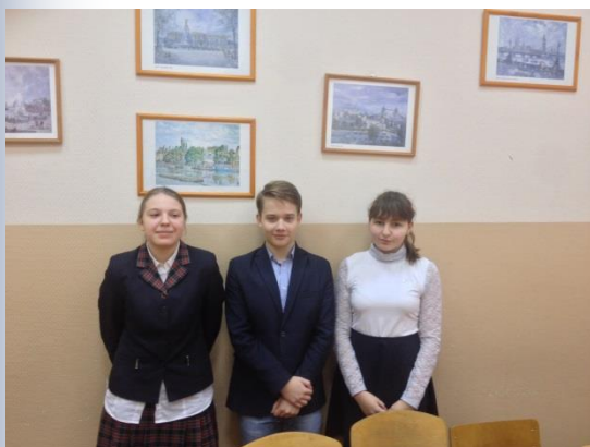
Лидеры школьного самоуправления

Наш девиз: Наш секрет сидит внутри. В классе личность – это мы!