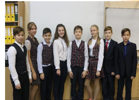
Наши спортсмены – представители сборной команды гимназии