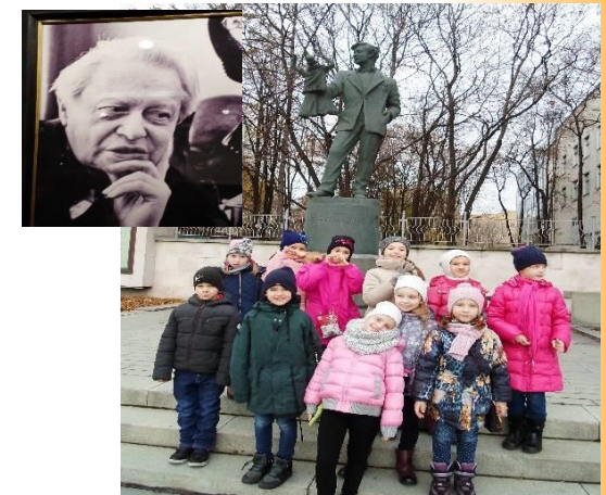
Развитие чувства прекрасного ( В ДКТ им. « Образцова » )