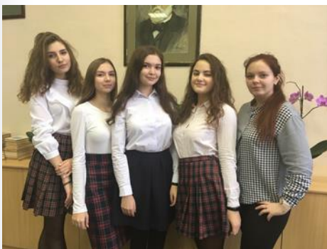
Победители и призеры I этапа Всероссийской олимпиады школьников