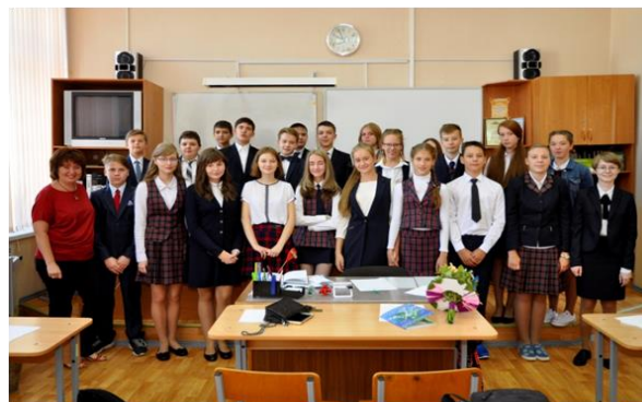
Развитие коллективного духа