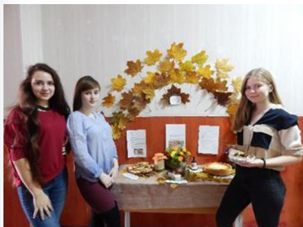
«Эко-ярмарка» Бережем планету вместе!

Наш девиз: «Словно к солнцу ростки Дружно тянемся к знаниям, Мы по духу близки В этом наше призвание!»