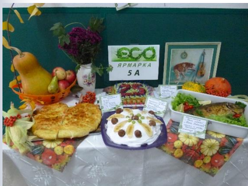
«Эко-ярмарка» Спасём планету вместе!