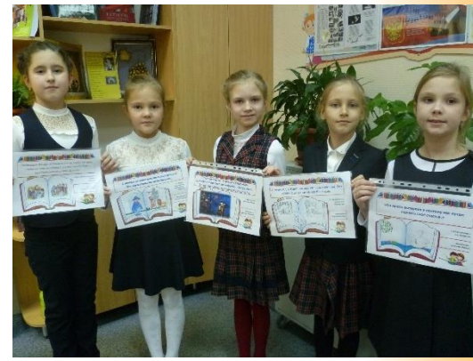
Активные участники реализации проекта «Читать не вредно, вредно не читать»