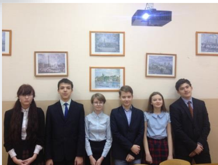
Победители и призеры I этапа Всероссийской олимпиады школьников