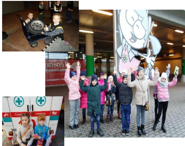
Познавательный туризм – поездка в Кидзанию г.Москва