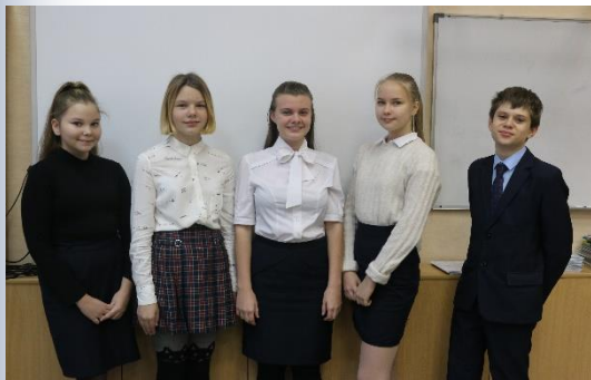
Лидеры школьного самоуправления