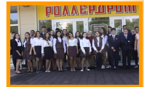
Спорт – для всех!