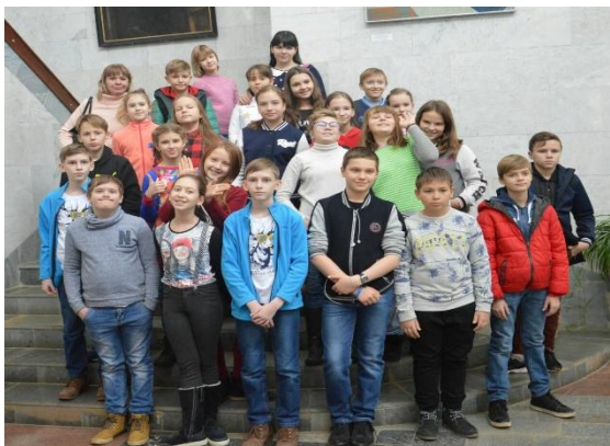
Бороться и искать, Найти, и не сдаваться!