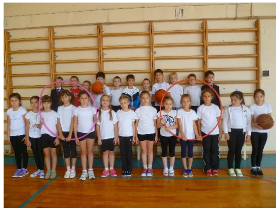
В здоровом теле здоровый дух!