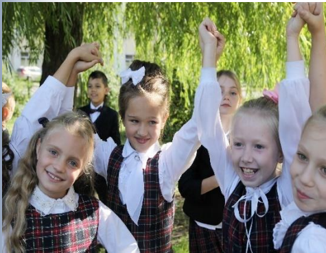
Участники проекта Сохраним жизнь деревьям!»