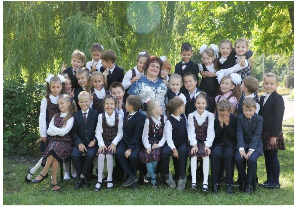
Вместе весело шагать по ступенькам знаний!