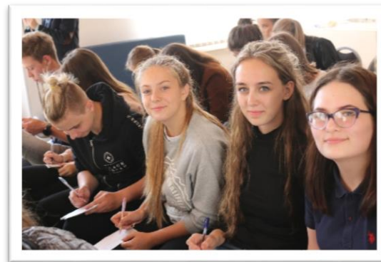
Лидеры школьного самоуправления