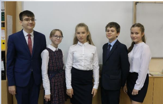
Победители и призеры I этапа Всероссийской олимпиады школьников