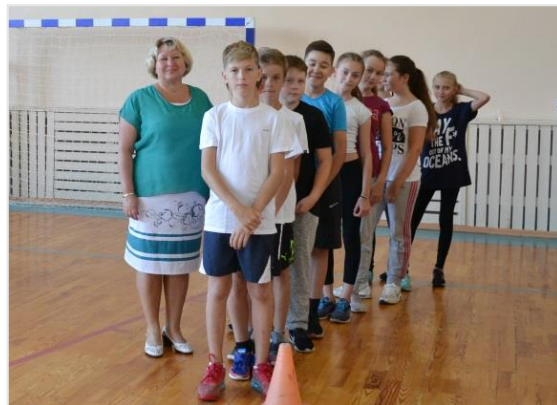
Один за всех и все за одного. Вместе мы сила!