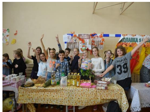
Пока мы вместе и едины – МЫ НЕПОБЕДИМЫ!