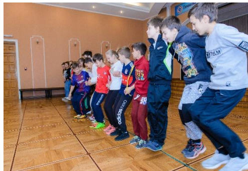
Развитие коллективного духа