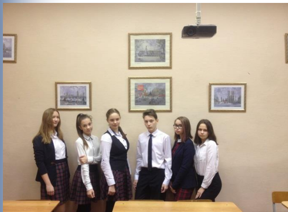
Лидеры школьного самоуправления

Наш девиз: В школьной жизни будь активным, креативным, позитивным. Своей школе помогай, след на память оставляй!