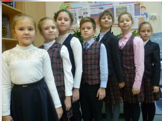
Победители и призеры I этапа Всероссийской олимпиады школьников