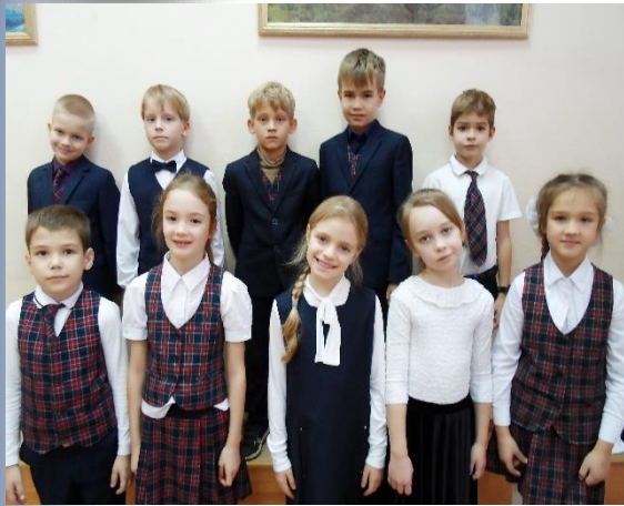
Победители и призеры Гимназической олимпиады младших школьников