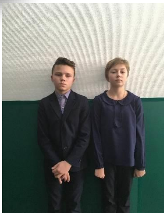
Победители и призеры I этапа Всероссийской олимпиады школьников.