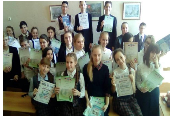
Развитие коллективного духа