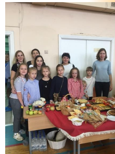
Осенняя благотворительная ярмарка