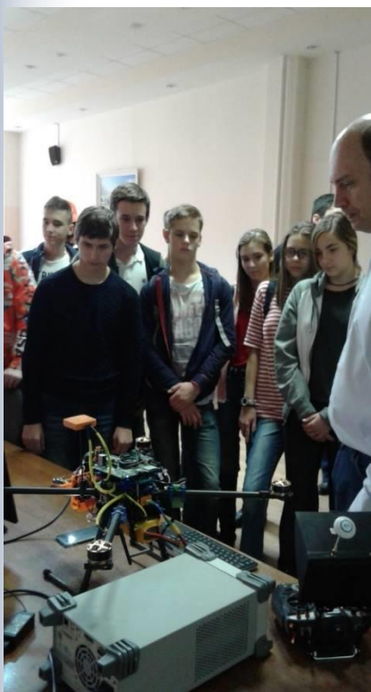
Экскурсия в ПензГТУ

В классе 26 активных творческих ребят! Круглые отличники – 3 человека Победители школьного этапа Всероссийской олимпиады – 21 человек Участники муниципального этапа Всероссийской олимпиады школьников – 11 человек