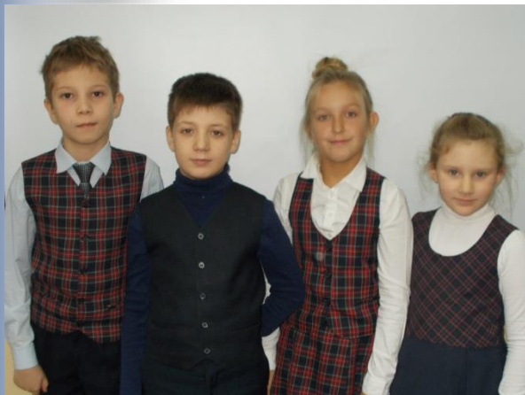
Победители и призеры I этапа Всероссийской олимпиады школьников