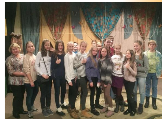
Развитие чувства прекрасного ( В ЦТИ «Дом Мейерхольда» )