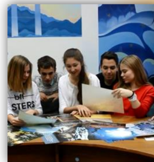
Лидеры школьного самоуправления

Наш девиз: «Словно к солнцу ростки Дружно тянемся к знаниям, Мы по духу близки В этом наше призвание!»