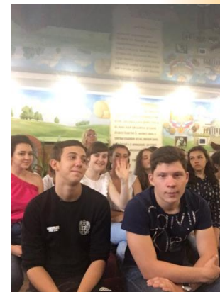
Познавательный туризм – экскурсия в с.Кувака