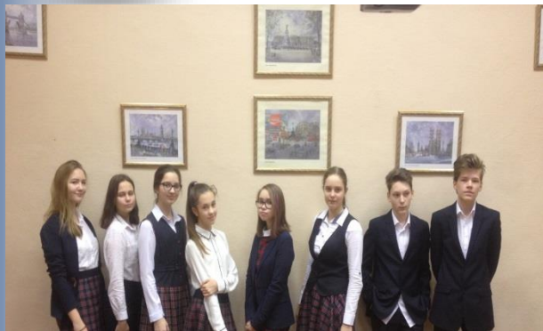
Победители и призеры I этапа Всероссийской олимпиады школьников