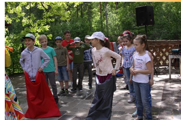
Делу время - потехе час!