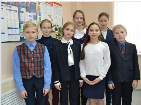
Победители и призеры I этапа Всероссийской олимпиады школьников