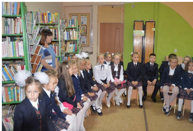
Посещение областной юношеской библиотеки