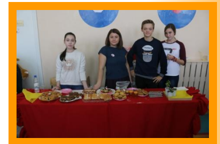
«Осенняя ярмарка» 9 «А» - 1 место!