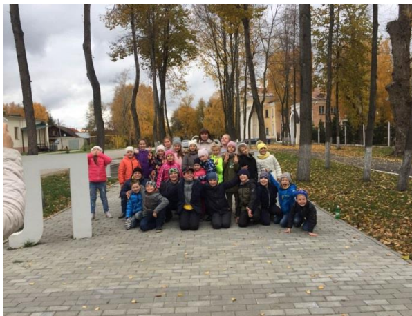
Поездка в Никольск