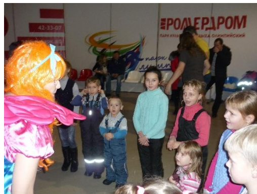
Культурная суббота «Здоровая семья»