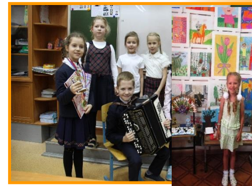
ЮНЫЕ МУЗЫКАНТЫ И ХУДОЖНИКИ