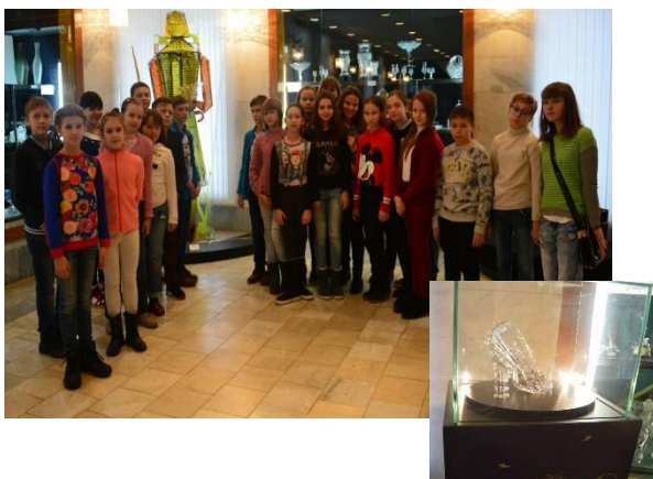
Образовательный проект «Культурные субботы»- поездка в Никольск.