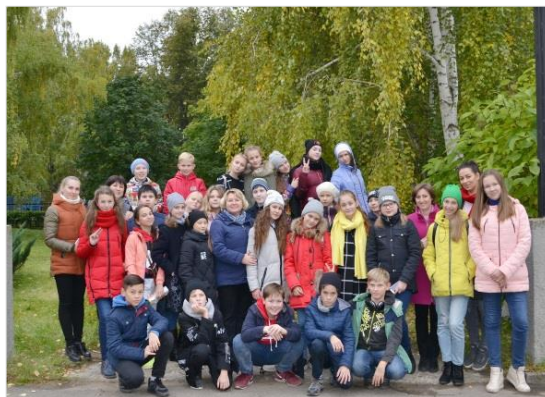
Познавательный туризм – поездка в Никольск